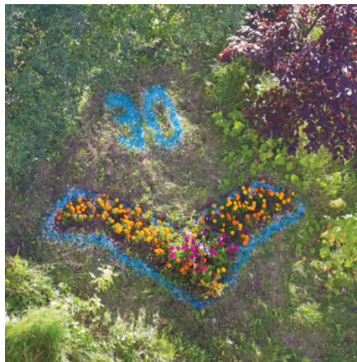
Клумба перед окнами офиса филиала ООО «Газпром флот» в г. Мурманске

В этом году 12 июля у нашей компании ООО «Газпром флот» было значимое событие – 30-летие со дня образования! Это много или мало? С одной стороны, за прошедшие годы «Газпром флотом» проделана колоссальная работа по освоению газовых и нефтяных месторождений на российском континентальном шельфе, увеличению промышленных запасов углеводородов, реализации масштабных проектов по направлениям развития нефтегазового сектора экономики России.