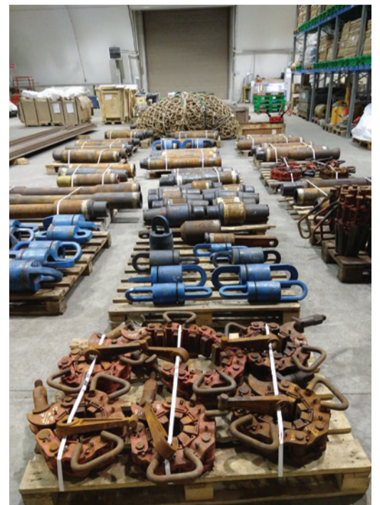
Склад базы материально-технического обеспечения в Холмске

Всего же на Сахалине через базу обеспечения происходит снабжение трёх судов «Газпром флота»: ТБС «Сатурн» и «Нептун», НИС «Академик Голицын». В 2024 году суда участвовали в долгих и трудных работах по буксированию буровых платформ к месту ремонта и обратно. Срок между двумя соседними заходами в порт для одного судна достигал трёх месяцев. Поэтому, чтобы избежать большого скопления груза, снабжение передавалось на одни суда через другие. Эта практика небезупречна, но в сегодняшних условиях является единственно возможной и зачастую помогает избежать дополнительных сложностей в эксплуатации судов. Ещё одной важной задачей подразделения можно назвать управление материально-техническими ресурсами, оставшимися с момента, когда на базе осуществлялись связанные с бурением скважин работы. Какие-то материально-технические запасы продаются, а какие-то сдаются в аренду другим компаниям.