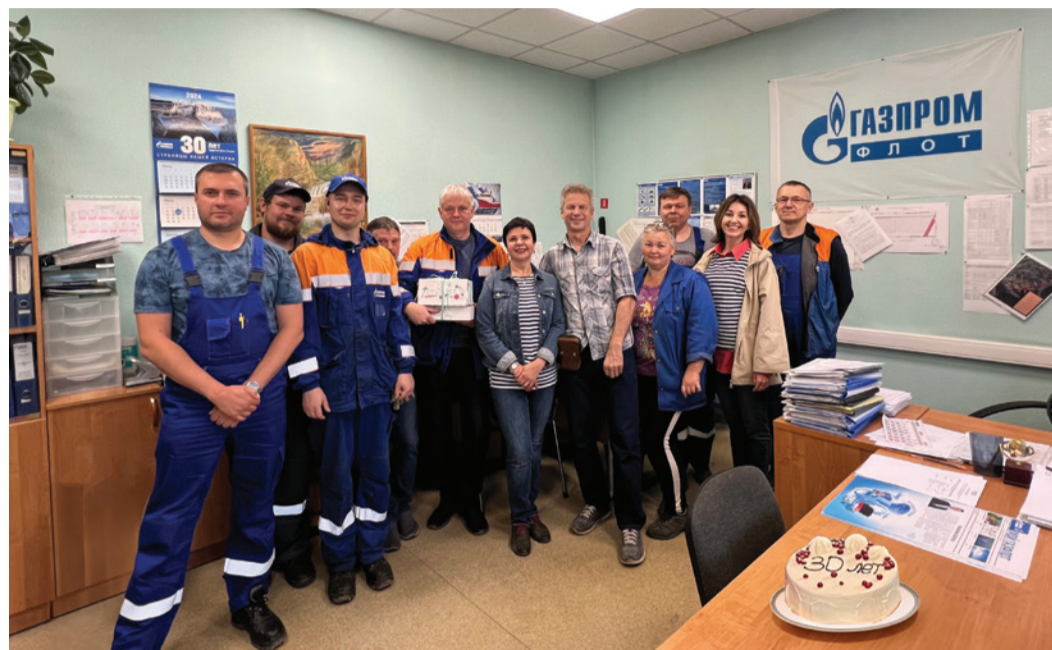
Работники производственного участка в г. Мурманске