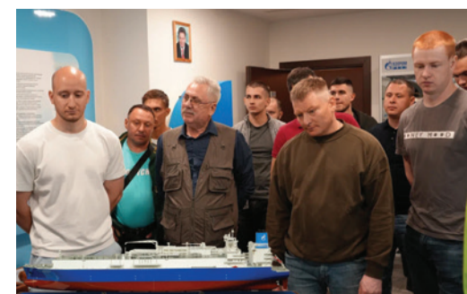
Экипаж судна «Портовый» в музее «Газпром флота»