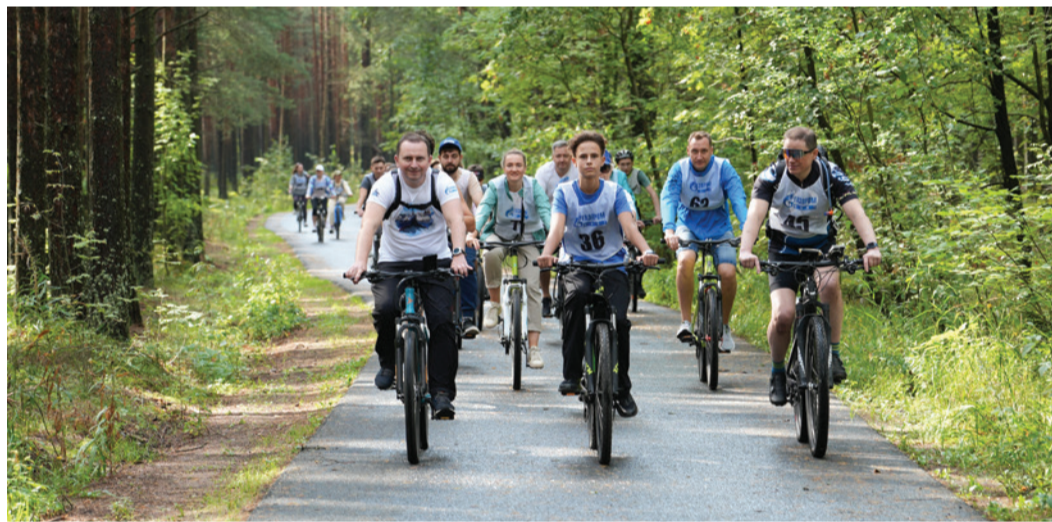
Газфлотовцы на велопробегах в Курортном районе Санкт-Петербурга

Укрепление семейных ценностей — одна из главных составляющих корпоративной политики ООО «Газпром флот». В компании основательно подходят к организации событий, целью которых является сплочение команды, в том числе в нерабочее время с участием членов семей сотрудников. В августе и сентябре состоялось несколько знаковых мероприятий, которые оставили яркий след в сердцах всех работников предприятия и их близких.