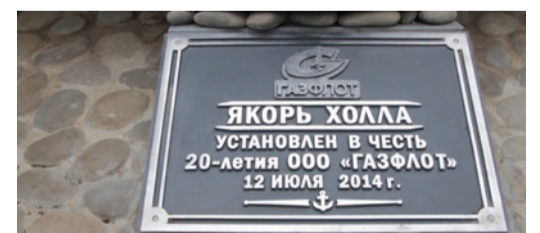
Информационная доска у «Якоря Холла» в Москве