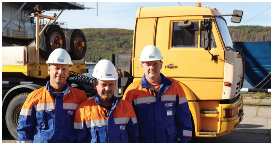
На производственном участке в Мурманске

К аждое структурное подразделение «Газпром флота» по-своему уникально, имеет накопленные годами опыт, традиции, богатый потенциал и перспективы.