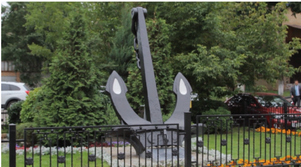
Монумент «Якорь Холла» на ул. Намёткина, 12А, в Москве

Якорь – один из обязательных атрибутов любого судна. Благодаря этому приспособлению обеспечивается стоянка корабля и его удержание вне зависимости от ветра и течения. Естественно, якоря используются и на судах и установках, эксплуатируемых «Газпром флотом», помогая выполнять масштабные задачи предприятия.