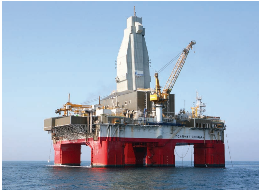
ППБУ «Полярная звезда»

Для выполнения поставленных на 2020 год задач всему коллективу «Газпром флота» – экипажам полупогружных плавучих буровых установок «Полярная звезда» и «Северное сияние», самоподъёмных плавучих уста-