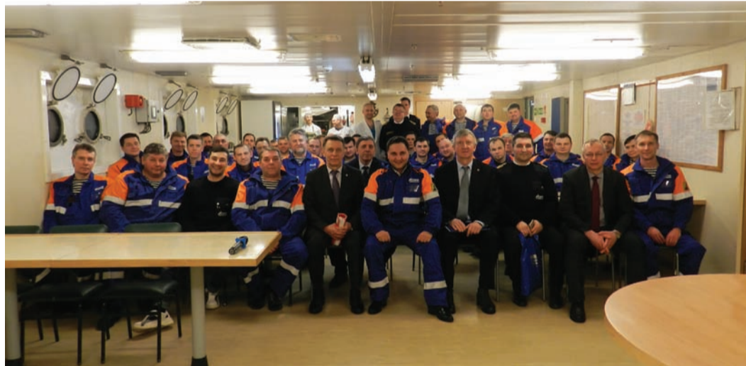
Собрание в филиале ООО «Газпром флот» в г. Мурманске

О собраниях по проверке выполнения коллективного договора. Отчеты и выборы в цеховых профсоюзных организациях.