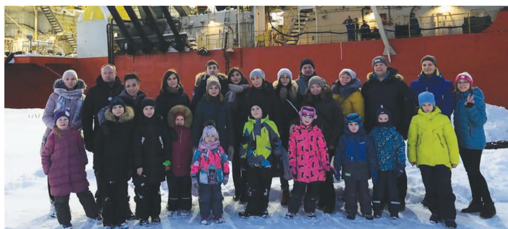
Дети работников филиала ООО «Газпром флот» в г. Мурманске у СПБУ «Арктическая»

Такие плановые ремонты судов позволяют своевременно обнаруживать критические разрушения в механизмах и оборудовании и своевременно устранять их, позволяя обеспечить готовность судов компании к выполнению поставленных производственных задач.