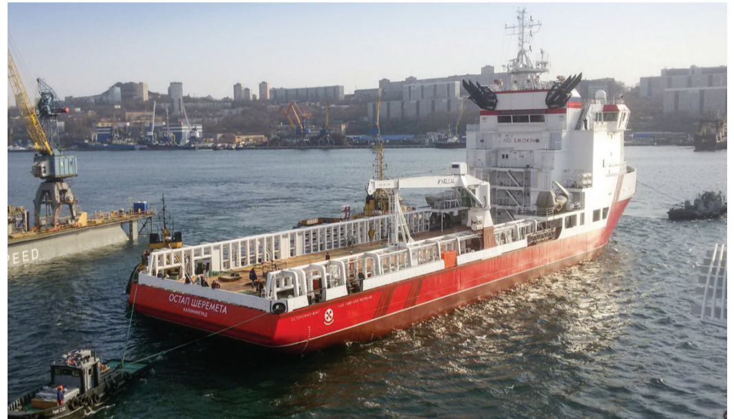
Судно снабжения «Остап Шеремета»

директор по производству ПАО «Амурский судостроительный завод»