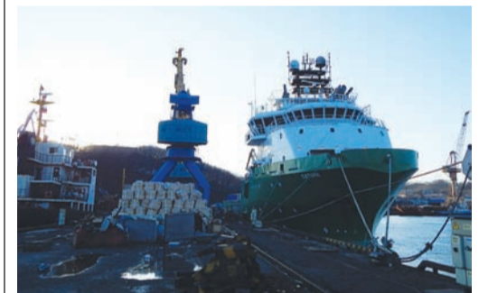
Транспортно-буксирное судно «Сатурн»