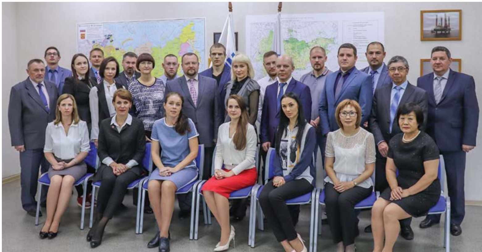
Коллектив Филиала ООО «Газпром флот» в г. Южно-Сахалинске

Кроме подготовки плавучих буровых установок и береговых сооружений к новому буровому сезону, обеспечения контроля за выполнением работ по текущему обслуживанию и ремонту