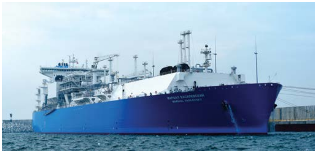
Плавающая регазификационная установка «Маршал Василевский».